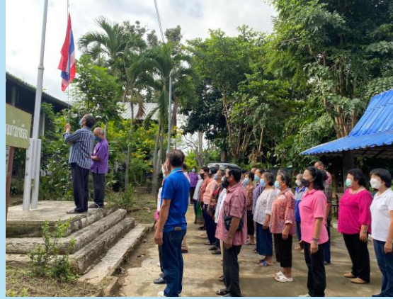
โรงเรียนผู้สูงอายุตำบลน้ำบ่อหลวง