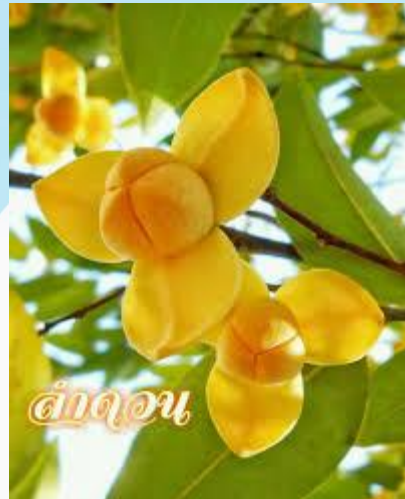
ดอกจันเป็นสัญลักษณ์ของผู้สูงอายุ